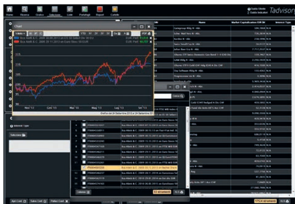
Tadvisory: analisi finanziaria quantitativa e qualitativa